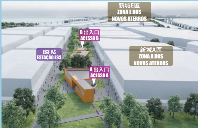
新城A區一般地下輕軌站

Durante as horas de ponta é comum encontrarem-se em Macau situações de congestionamento de trânsito designadamente nas redondezas das Portas do Cerco. Com a entrada em funcionamento da Linha Leste do Metro Ligeiro será disponibilizado ao público um meio de transporte rápido, confortável, ecológico e fiável, que liga as Portas do Cerco, as Zonas A e E dos Novos Aterros e a Taipa, contribuindo para a redução dos congestionamentos rodoviários.